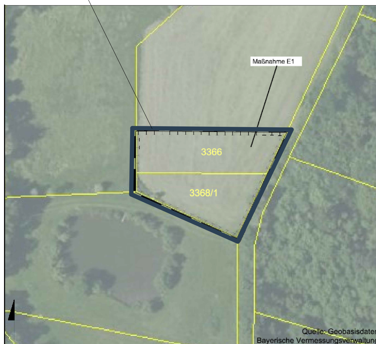
Geltungsbereich 2 - Zuordnung Maßnahme E1